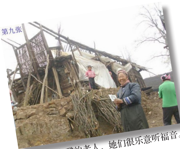
接受福音碟的老人，她们很乐意听福音。