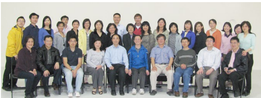
参观新建成的西区新堂。纪念迁居加州的国才弟兄和建川弟兄。