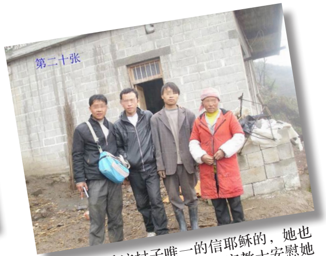
这位妇女是这个村子唯一的信耶稣的，她也嫁到这个地方很痛苦，后来宣教士安慰她说：“上帝让你来这边，为要让你在这里见证神的大能”，她开心地笑了。